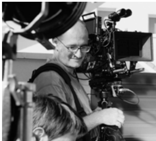
Jean-François Tuso / Réalisateur

+33 6 74 00 72 25 jftuso@madgicmovies.com madgicmovies.com