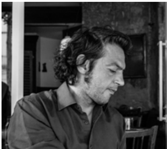
Ivanoel Barreto / Photographe

+33 6 61 92 70 04 ivanoelbarreto@gmail.com ivanoel-barreto.com